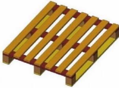
משטח קוביות 120x100 כללי